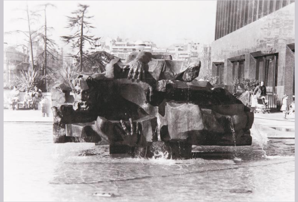
Homenaje a la fuente y el río. 1971-1972. Bronce, Calle Serrano, Madrid.